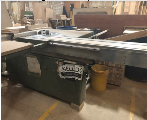
Fotografía 5. Sierra escualizable 1