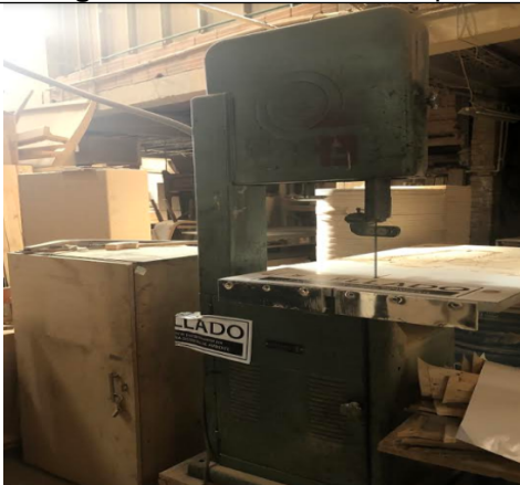
Fotografía 3. Máquina sinfin