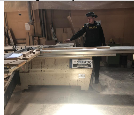
Fotografía 6. Sierra escualizable 2