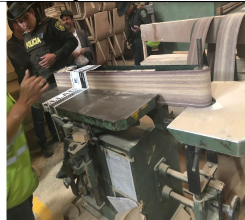
Fotografía 4. Lijadora vertical