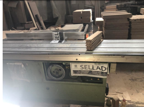
Fotografía 2. Sierra circular